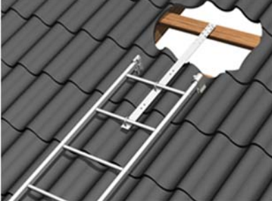
Kuva 1. Pelti- ja huopakatto