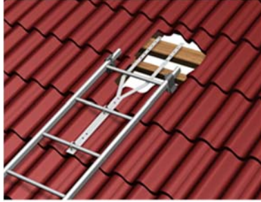
Kuva 2. Tiilikatto