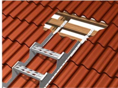
Kuva 2. Tiilikatto