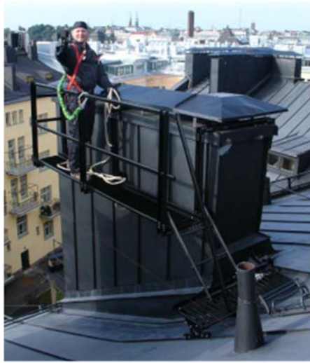
Kuva 2. Jälkeen