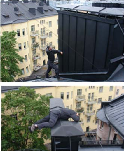
Kuva 1. Ennen