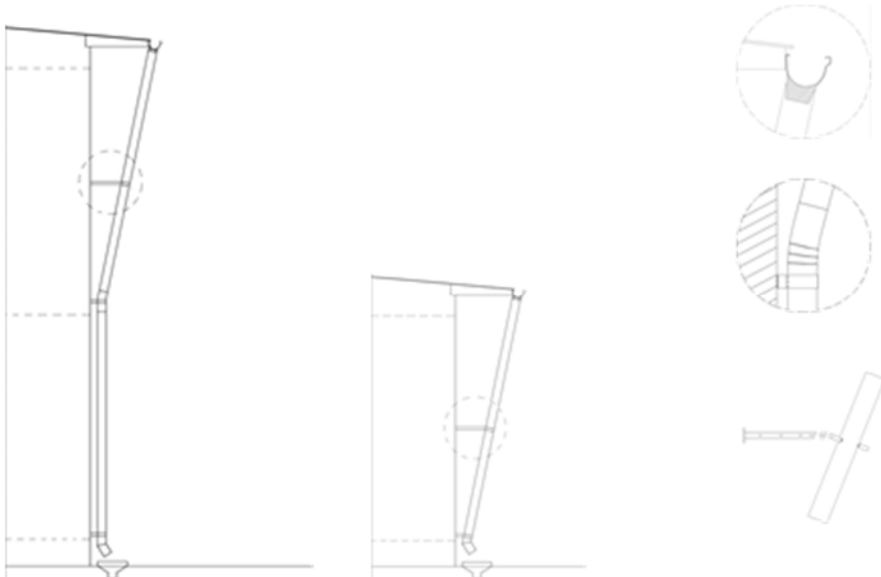
Kuva 1. Vinot alastulot 2 krs ja 1 krs -rakennuksessa, yksityiskohdat