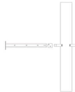
Kuva 4. Ulostuonti yli 175 mm