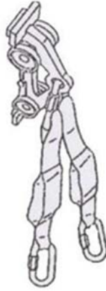
Kuva 1. Nousukisko