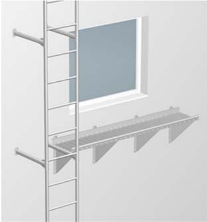
Kuva 1. Parannettu hätäpoistumistie