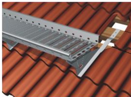
Joonis 2. Kivikatuse