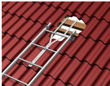
Joonis 2. Kivikatus