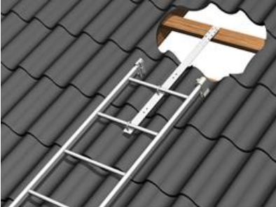
Joonis 1. Plekk- ja ruberoidkatus Valtsplekk- ja Classic-katus