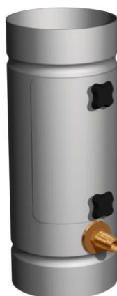
Joonis 2. P10 veekogur