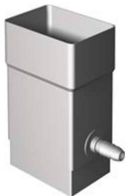
Joonis 1. K7 × 10 veekogur