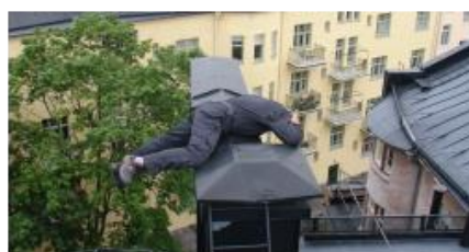
Joonis 1. Enne