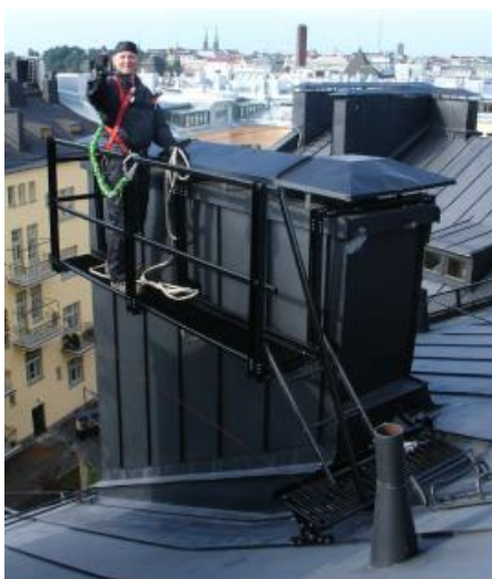
Joonis 2. Pärast