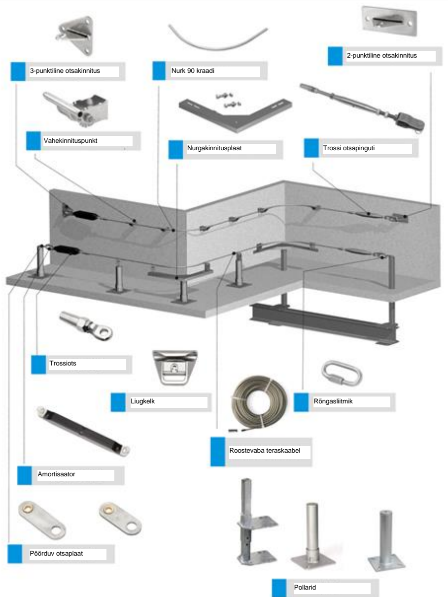
Joonis 2. Süsteemi osad (ennekõike seina- ja pollarikinnituse korral)