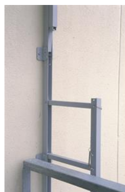
Joonis 3. Redel avatuna