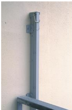
Joonis 1. Redeli ülaots ühenduskoha juurest