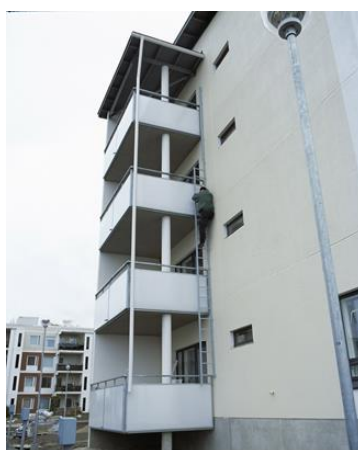
Joonis 5. Inimene evakueerub rõdult