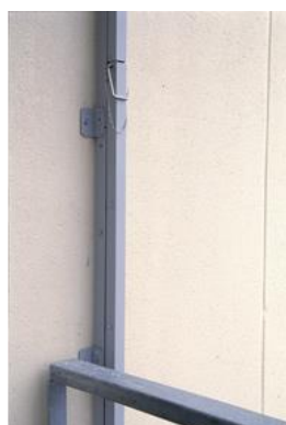
Joonis 2. Redeli ühenduskoht