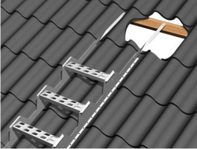
Joonis 1. Plekk- ja ruberoidkatatus Valtsplekk- ja Classic-katus