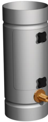
Bild 2. P10 vattenuppsamlare