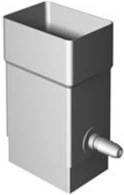
Bild 1. K7 x 10 vattenuppsamlare