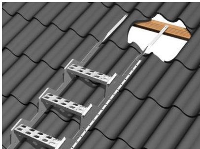
Bild 1. Plåt- och filttak Classic-tak