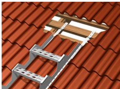
Bild 2. Tegeltak