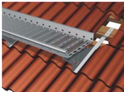
Bild 2. Tegeltak TK-KAT