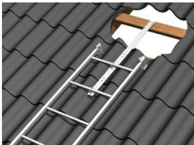
Bild 1. Plåt- och filttak Classic-tak