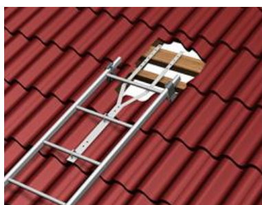
Bild 2. Tegeltak